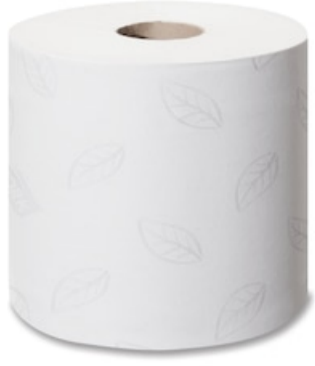
Tork SmartOne Mini TR Adv 2p 620s 472293